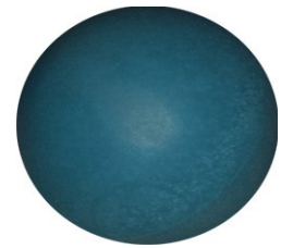
TAG RFID ESFERICO